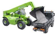
Macchine movimento terra